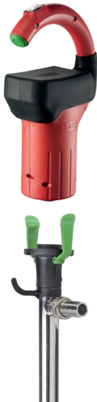
Насос COMBIFLUX с двигателем FBM-B 3100

Компактные бессальниковые насосы COMBIFLUX FP 314 можно также использовать вместе с новым уникальным аккумуляторным двигателем FBM-B 3100, который вообще не требует обслуживания. При работе с аккумуляторным двигателем насосы имеют впечатляющую для своих размеров производительность. Сменные аккумуляторные батареи двигателя имеют длительный срок службы и малое время зарядки. Насосы идеально подходят для применения в условиях, где использование устройств с питанием от сети затруднено или нежелательно, а также в местах, где нет доступа к электрической сети (например, на улице).