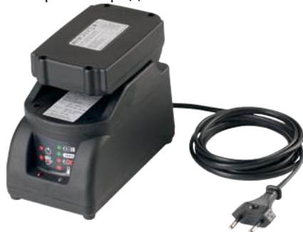
Полная зарядка аккумуляторной батареи за 30 минут.