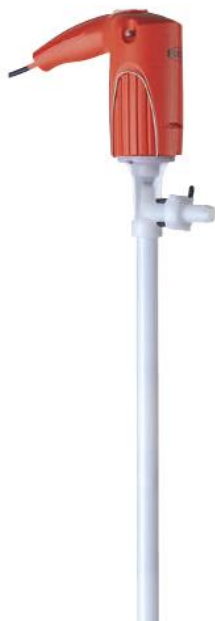
JUNIORFLUX F 314 (см. с. 4)