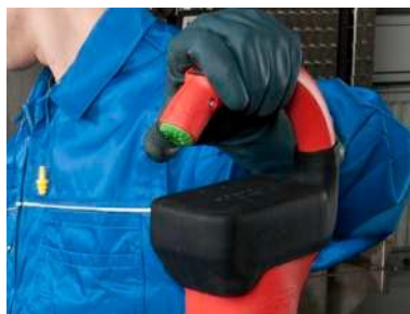
Производительность насоса регулируется путем плавного изменения частоты вращения двигателя.