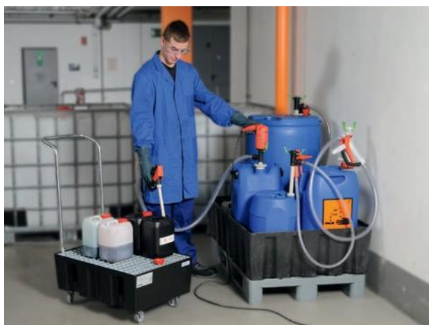
Использование нескольких насосов COMBIFLUX с одним двигателем FEM 3070.

* Измерено на выходе насоса для воды температурой +20 °С, может изменяться в зависимости от материала наружной трубы.