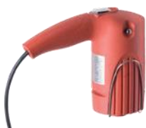
FEM 3070 (см. с. 5)