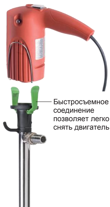
Насос COMBIFLUX с двигателем FEM 3070

Компактный бессальниковый насос COMBIFLUX FP 314 можно использовать вместе с коллекторным двигателем FEM 3070 (питание от сети). Модульная конструкция насоса позволяет использовать один двигатель для нескольких насосов поочередно. Так же как и модели JUNIORFLUX, насосы COMBIFLUX хорошо подходят для откачки небольшого количества жидкости из бочек и контейнеров IBC объемом до 1000 л. Благодаря небольшому диаметру наружной трубы насосы позволяют откачивать жидкости даже через узкие отверстия.