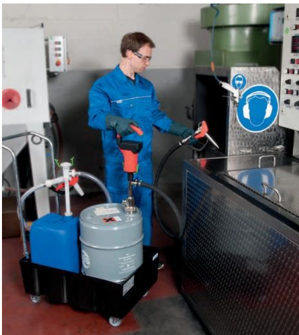
Мобильность при эксплуатации насоса благодаря отсутствию кабеля электропитания