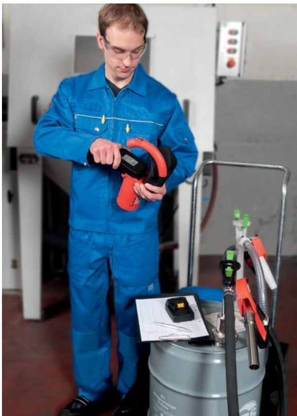
Минимальные перерывы в работе благодаря съемной аккумуляторной батарее.