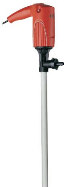
JUNIORFLUX F 310 (см. с. 4)