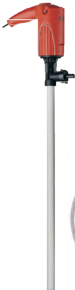
Насос JUNIORFLUX в сборе